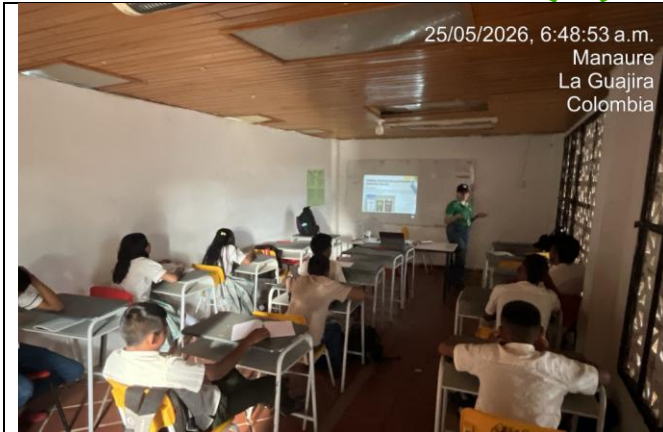
Ilustración 1. Formación técnico Monitoreo Ambiental Comunidad de Malawaisao - Municipio de Manaure