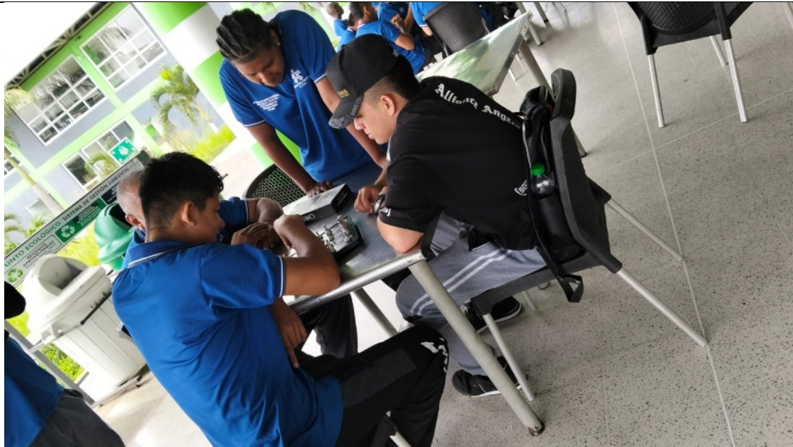
Aprovechamiento del tiempo libre: Ajedrez