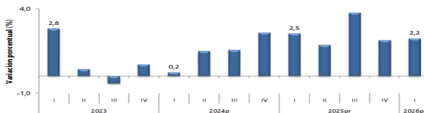
Gráfico 1. Producto Interno Bruto Tasa de crecimiento en volumen 1 2023-I / 2026 Pr -I

Fuente: DANE, PIB_T 1 Serie encadenadas de volumen con año de referencia 2015 Pr preliminar P provisional