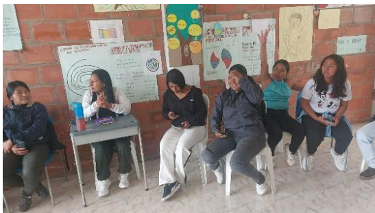
FICHA: 3496260, Estrategias Integradas de marketing, clases presenciales, en esta fotografía observamos a los aprendices el municipio de Toribio- Tacueyo