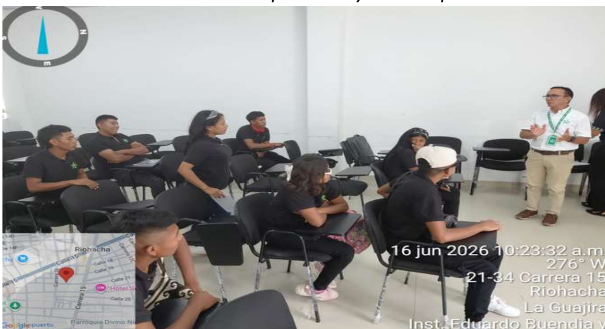
Ilustración 12: Formación en el técnico en Emprendimiento y Fomento Empresarial: 3161702.

Nota. Imagen de los aprendices de la Etnoeducativa No. 10 de Curumaná, Fuente: Elaboración propia