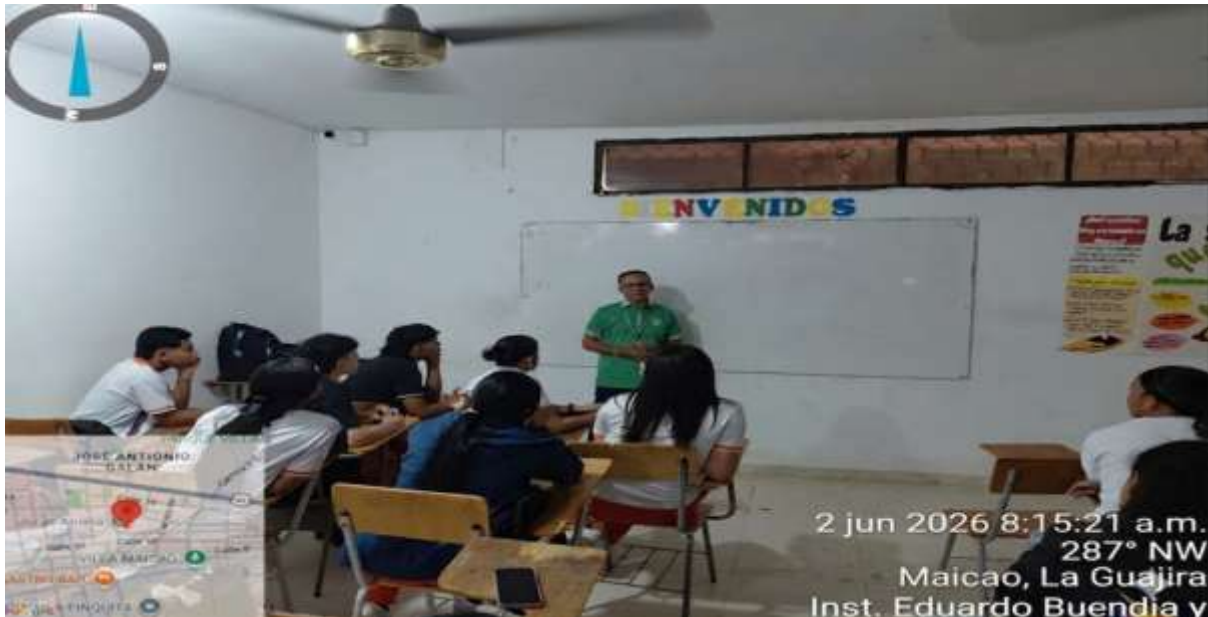
Ilustración 8: formación en el técnico en Asistencia Administrativa: 3177082.

Nota. Imagen de los aprendices de la I.E. Jorge Arrieta Maicao .