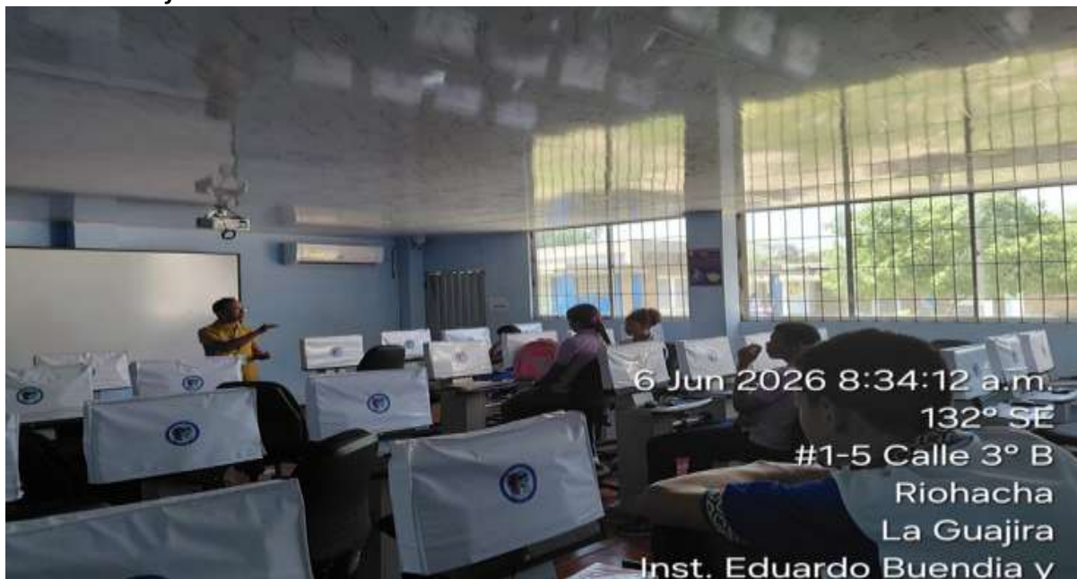
Ilustración 10: formación en el técnico en Monitoreo Ambiental: 3161966.

Nota. Imagen de los aprendices de la I.E. Eugenia Herrera de Matitas .