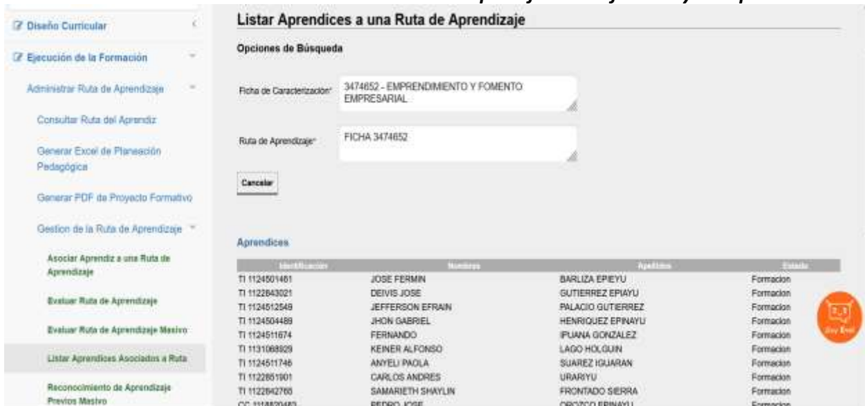
Ilustración 22: actualización de los documentos en la plataforma Sofia Plus y Compromiso.

Nota: Screenshot Sofia Plus estado de los aprendices de las fichas asignadas