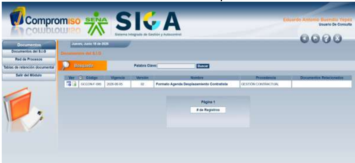
Ilustración 21: Actualización de los documentos en la Compromiso.

Nota: Screenshot plataforma Compromiso, Actualización formatos, GCCON-F-095