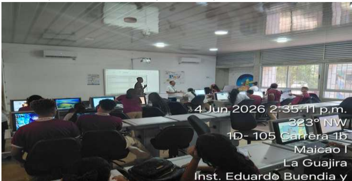
Ilustración 2: formación en el técnico en Programación de Software: 3160407

Nota. Imagen de los aprendices de la institución E. Manuel Rosado Iguaran Maicao.