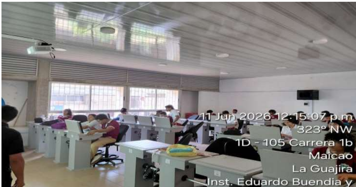
Ilustración 4: formación en el técnico en Programación de Software: 3160407

Nota. Imagen de los aprendices de la institución E. Manuel Rosado Iguaran Maicao .