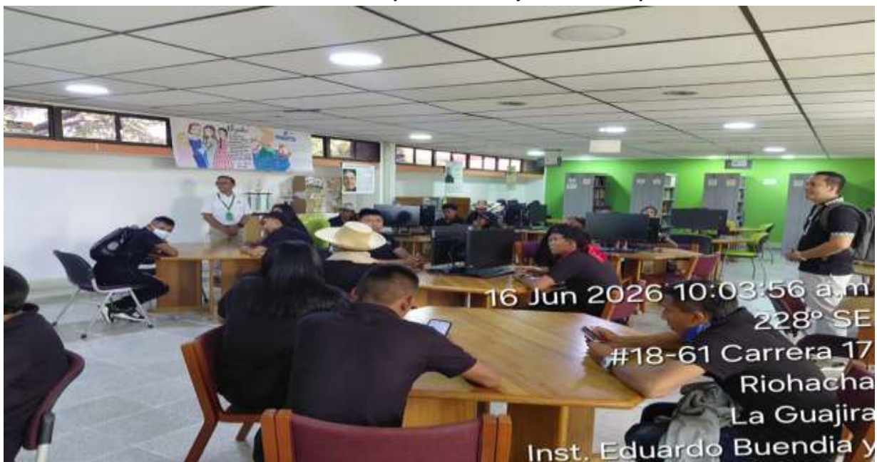
Ilustración 14: Formación en el técnico en Emprendimiento y Fomento Empresarial: 3161702.

Nota. Imagen de los aprendices de la Etnoeducativa No. 10 de Curumaná, Fuente: Elaboración propia