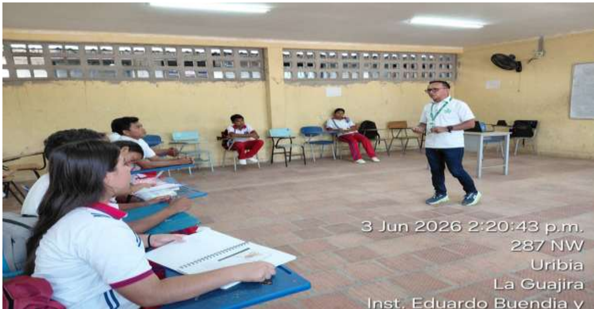
Ilustración 6: formación en el técnico en Emprendimiento y fomento Empresarial: 3474652.

Nota. Imagen de los aprendices de la I.E. Alfonso López Pumarejo Uribia .