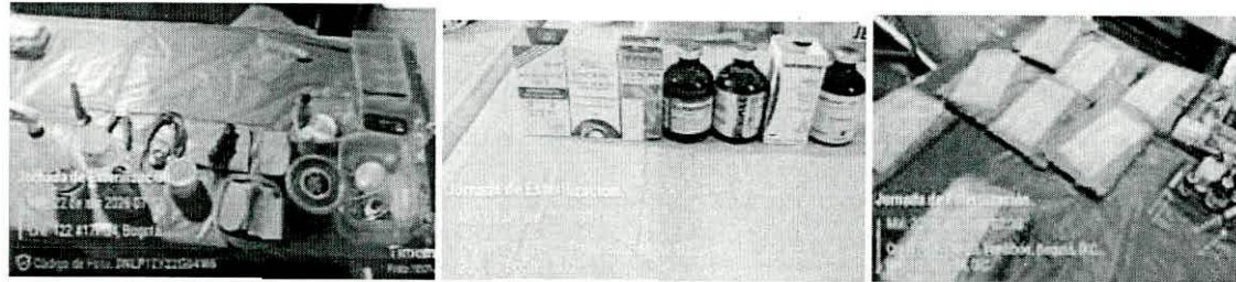
Algunos de los implementos usados en las jornadas de esterilización

para la correcta ejecución de las esterilizaciones, atenciones en brigadas y urgencias realizadas en el periodo, cumpliendo con las especificaciones del anexo técnico