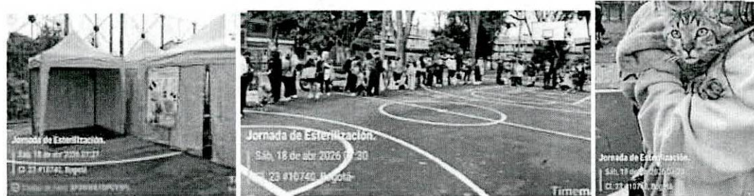
Jornada de esterilización N°11, en el barrio Versalles, del periodo N°4