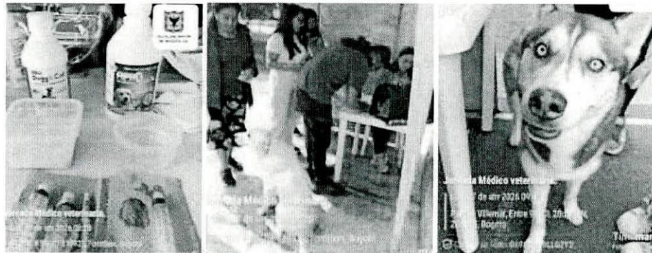
Brigada medico veterinaria N°9, desarrollada en el barrio Villemar, el 27 de abril de 2026

La prestación de los servicios se realizó en los puntos concertados por el Comité Técnico de Seguimiento y la Alcaldía Local de Fontibón. Se cumplió con el desplazamiento de la Unidad Móvil Quirúrgica en La Rosita, Versalles, San Pablo, y Zona Franca, así mismo el equipo de brigadas médico veterinarias a los caninos y felinos de comunidad en general, en los sectores de: Kassandra, Saturno, Portón de la Sabana y Villemar, siguiendo los protocolos y procedimientos técnicos estipulados en el anexo técnico para cada componente.