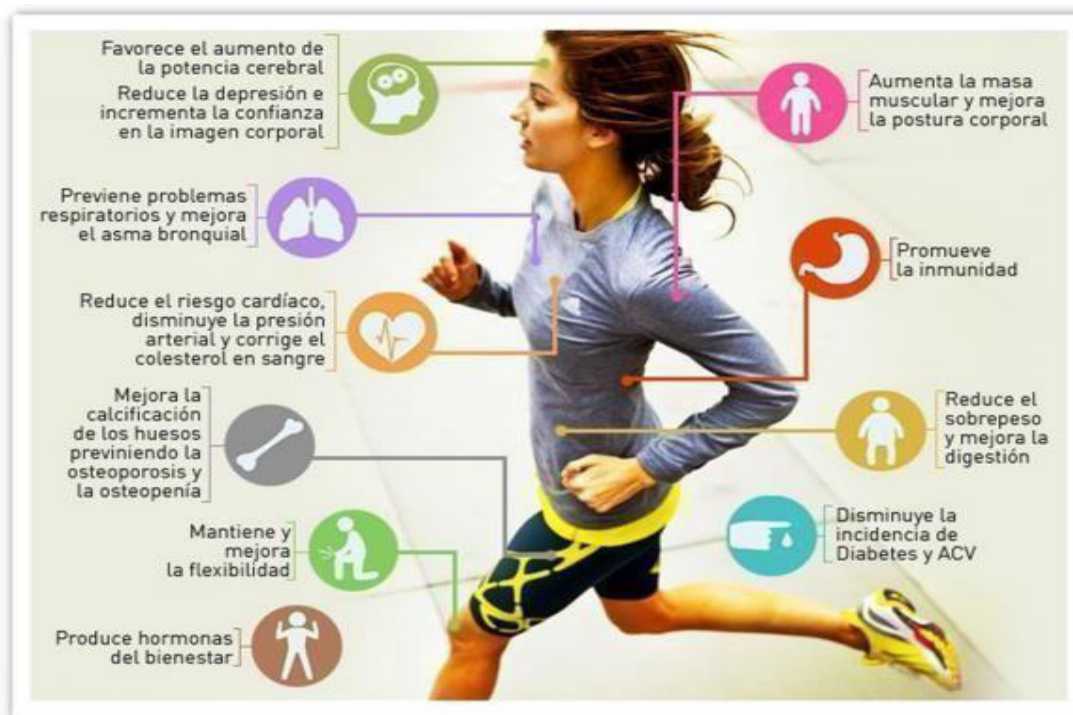
Imagen 12: beneficios de la actividad física.

Ocurre cuando las personas no cumplen con el mínimo recomendado de actividad física.