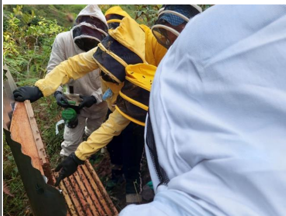
Actividad: Práctica apícola BPAP Fecha: 13 de junio de 2026 Lugar: predios aprendices