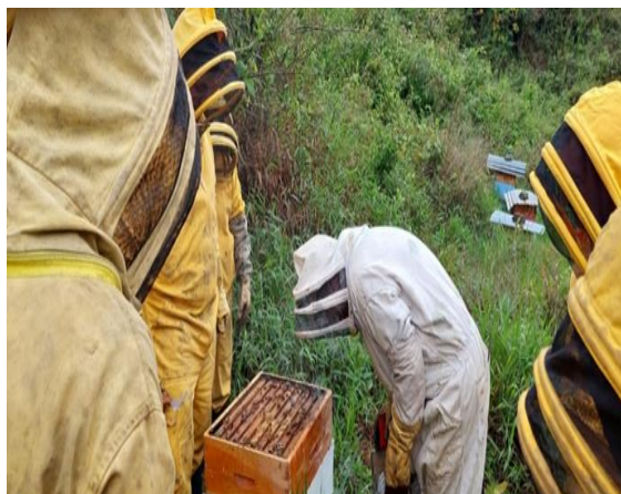
Actividad: Practica BPAP Fecha: 13 de junio de 2026 Lugar: predios de los aprendices.