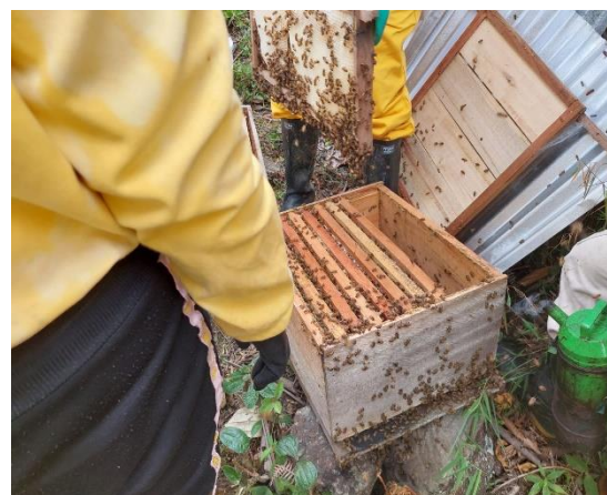
Actividad: Práctica grupo aprendices BPAP Fecha: 13 de junio de 2026 Lugar: predios aprendices