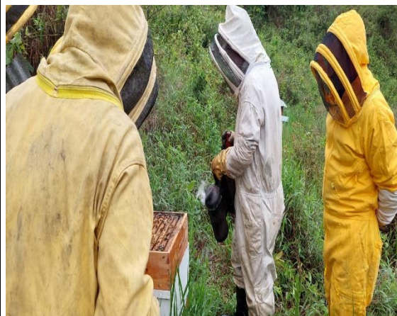
Actividad: Práctica apícola BPAP – uso responsable del ahumador Fecha: 13 de junio de 2026 Lugar: predios aprendices