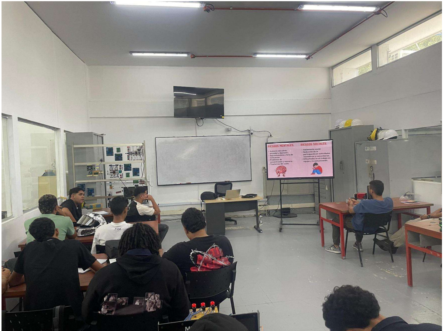
Charlas sobre salud mental, manejo del estrés laboral y equilibrio entre vida personal y trabajo.