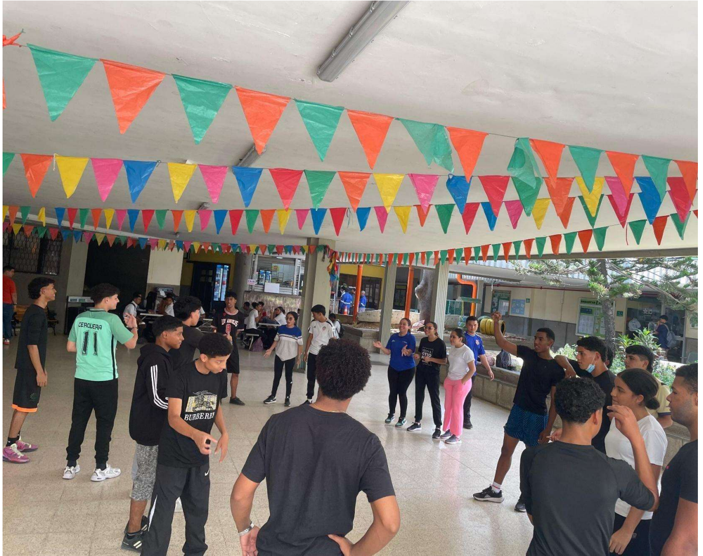
Diseño y ejecución de pausas activas estructuradas y actividades físico-recreativas orientadas a la prevención del sedentarismo.