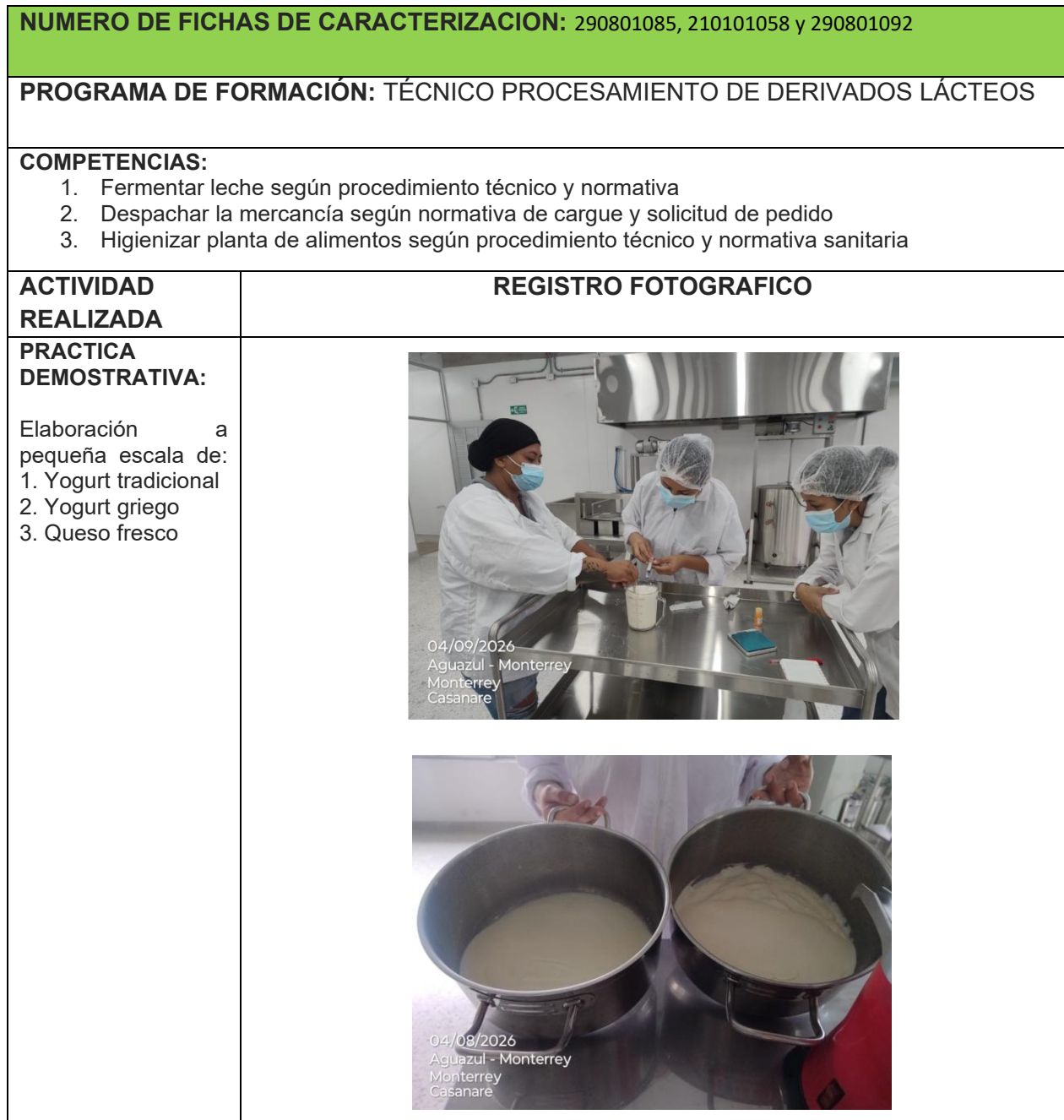
TABLA 1: EVIDENCIAS DE APRENDIZAJE

EVIDENCIAS EJECUCIÓN CONTRATO CO1.PCCNTR.8942438 del 19 de enero de 2026