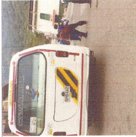
Ruta 4. Puente Pinzón-Boavita