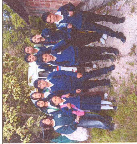
Ruta 6. Chulavita-San Francisco