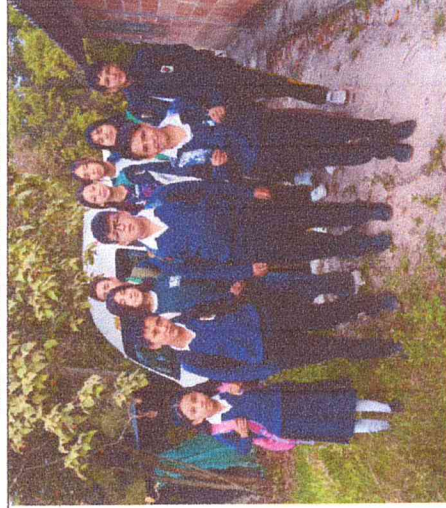
Ruta 6. Chulavita-San Francisco