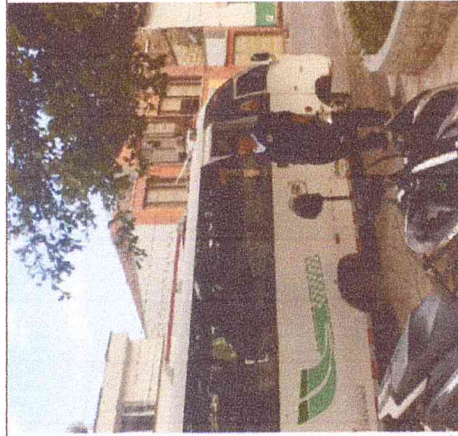
Ruta 4. Puente Pinzón-Boavita