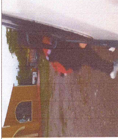
Ruta 3. Las Palmas-Espigón-Boavita