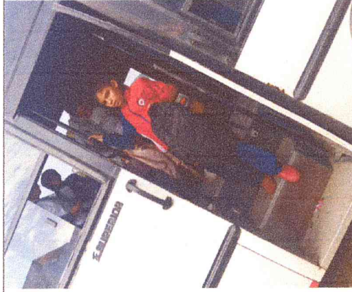
Ruta 1. Sauzal-Boavita