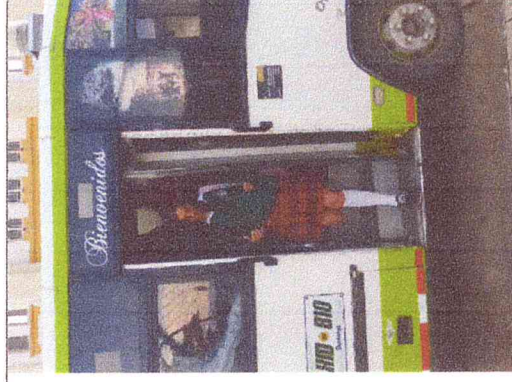
Ruta 2. Chulavita-Boavita