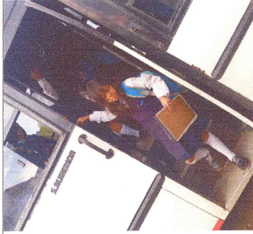
Ruta 1. Sauzal-Boavita