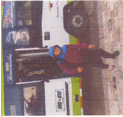
Ruta 2. Chulavita-Boavita