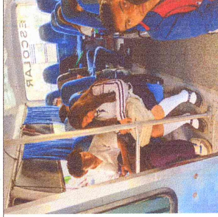
Ruta 7. Cabrerita-Guamito-Boavita