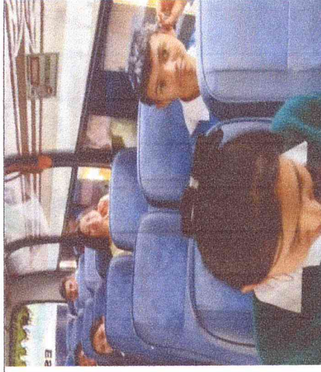
Ruta 5. Tunal-San Francisco-Boavita