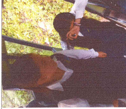
Ruta 1. Sauzal-Boavita