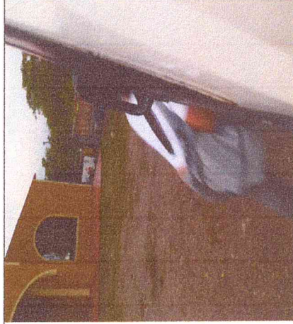
Ruta 3. Las Palmas-Espigón-Boavita