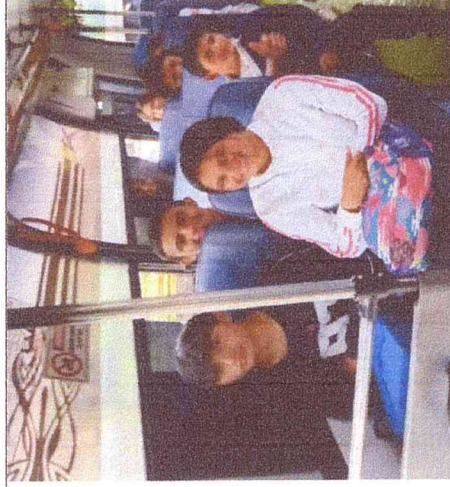
Ruta 5. Tunal-San Francisco-Boavita