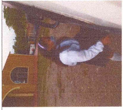
Ruta 3. Las Palmas-Espigón-Boavita