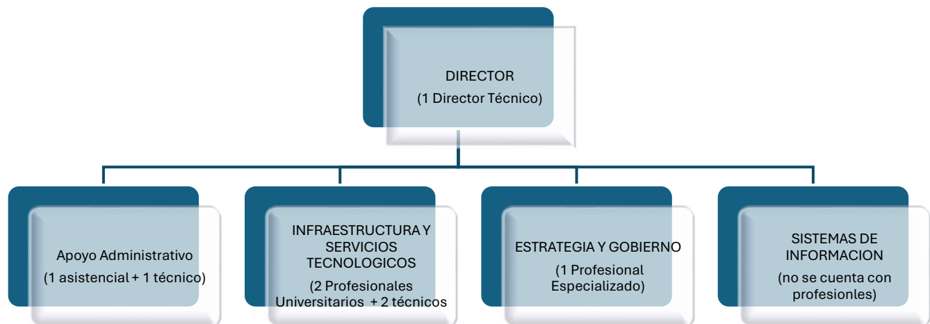
Gráfica 1. Estructura funcional de la DTSI – Vigencia 2026

Si bien la DTSI cuenta con una estructura funcional definida y con personal de planta, dicha capacidad resulta insuficiente frente al volumen, complejidad y especialización de las actividades que deben desarrollarse para asegurar el cumplimiento de los compromisos institucionales de la vigencia 2026 e inicios de la vigencia 2027. Esta conclusión no solo se deriva de la dinámica operativa del área, sino también del avance institucional en materia de análisis de cargas laborales y optimización organizacional, que evidenció la necesidad de fortalecer la planeación estructural y la eficiencia organizacional de la entidad.