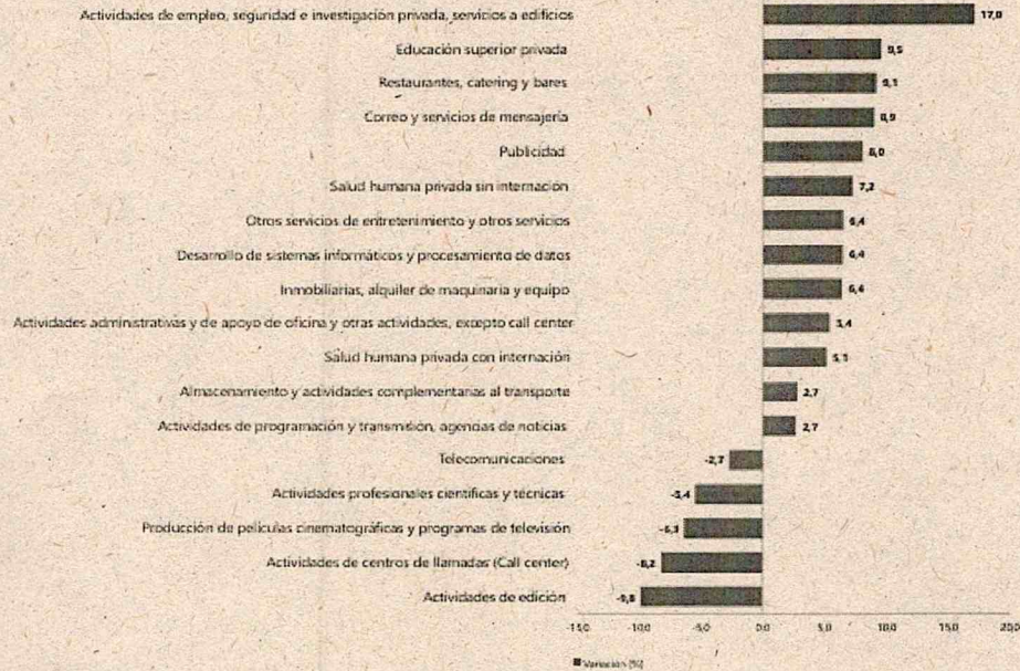
Gráfico 1. Variación anual de los ingresos nominales, según subsector de servicios Total nacional Octubre 2025 P / octubre 2024