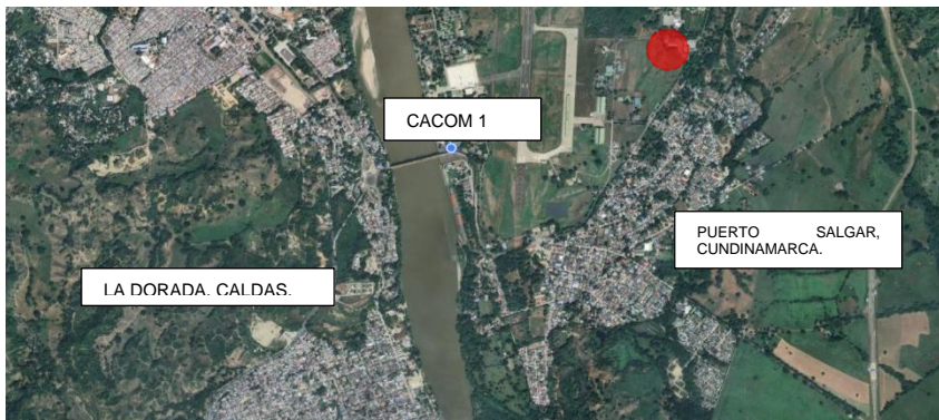
Figura 1.1. El proyecto se localiza en la Base Aérea Germán Olano - Puerto Salgar.