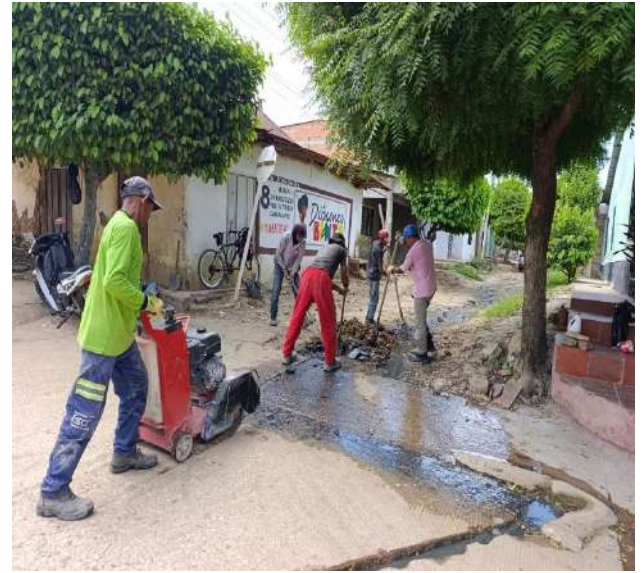
FOTOGRAFIA13 : INSPECCION EN TUBERIA PRINCIPAL POR POSIBLE TAPON EN LA CALLE 27 CARRERA 42