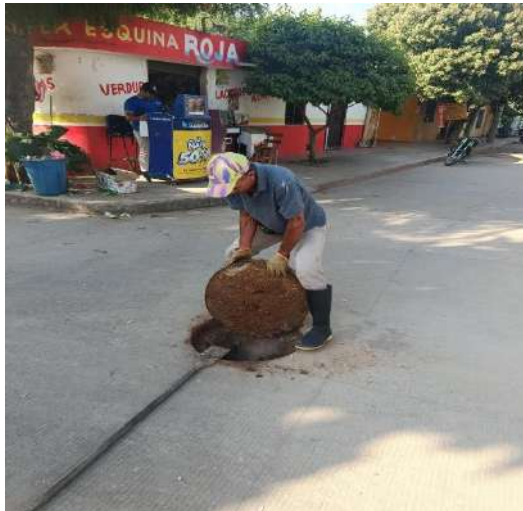
FOTOGRAFIA 03: LIMPIEZA BARRIO LAS PALMAS