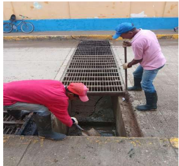
FOTOGRAFIA 08: LIMPIEZA REJILLAS PLUVIALES CALLE 24