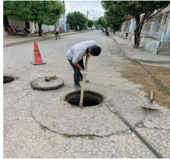
FOTOGRAFIA 06 : LIMPIEZA MH CALLE 27 CARRERA 44