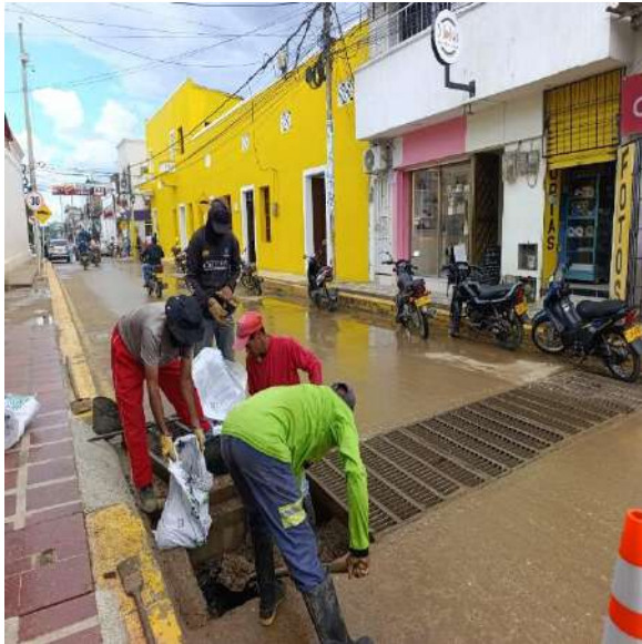
FOTOGRAFIA 12: LIMPIEZA SUMIDEROS CALLE 24