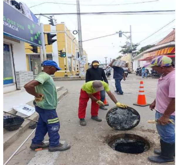
FOTOGRAFIA 02: LIMPIEZA MH BARRIO EL CENTRO