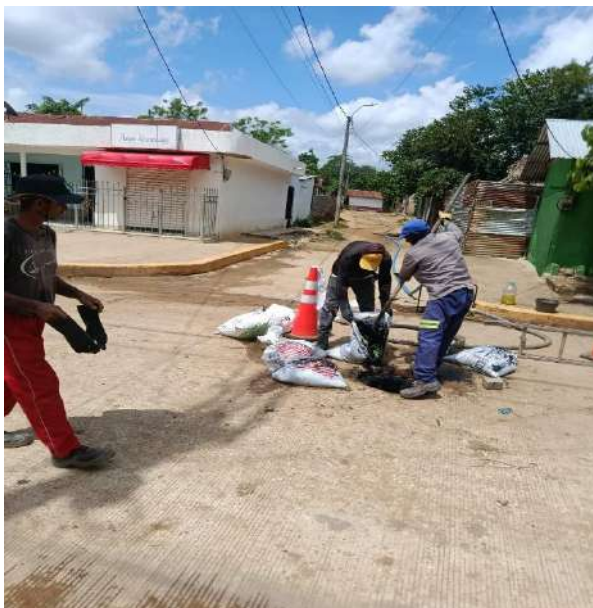
FOTOGRAFIA 11: LIMPIEZA BARRIO EL PARAMO