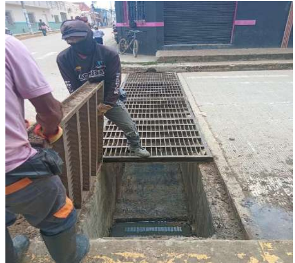
FOTOGRAFIA 10: LIMPIEZA REJILLAS PLUVIALES CALLE 24