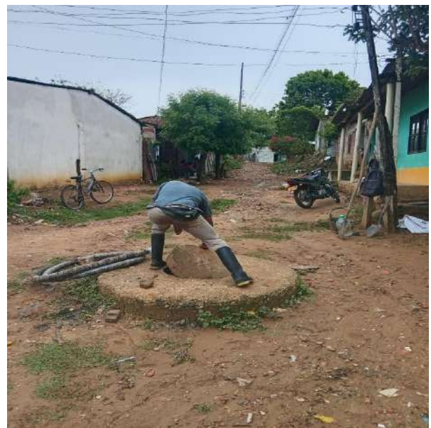
FOTOGRAFIA 12: INSPECCION MH BARRIO EL PARAMO