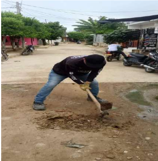
FOTOGRAFIA 05: INSPECCION DOMICILIARIA BARRIO LAS MERCEDES