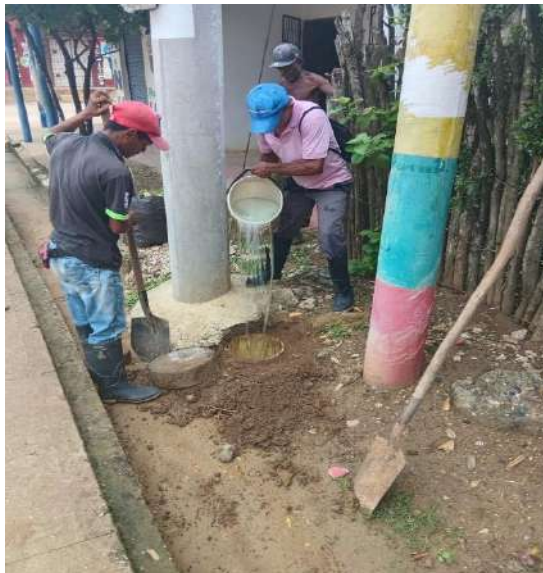
FOTOGRAFIA 07: INSPECCION CAJA DE REGISTRO PRUEBA