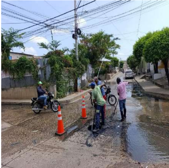
FOTOGRAFIA 01: LIMPIEZA DE MH BARRIO SANTANDER