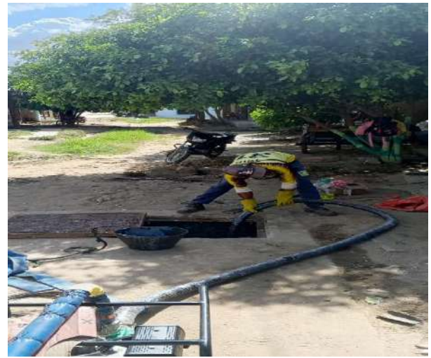
FOTOGRAFIA 04: LIMPIEZA LAS MERCEDES