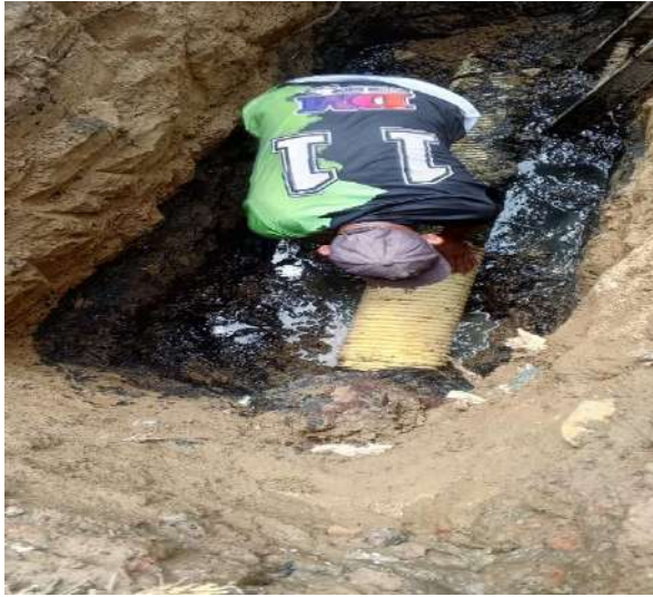
FOTOGRAFIA 09: RETIRANDO TAPON EN TUBERIA PRINCIPAL BARRIO EL PARAMO