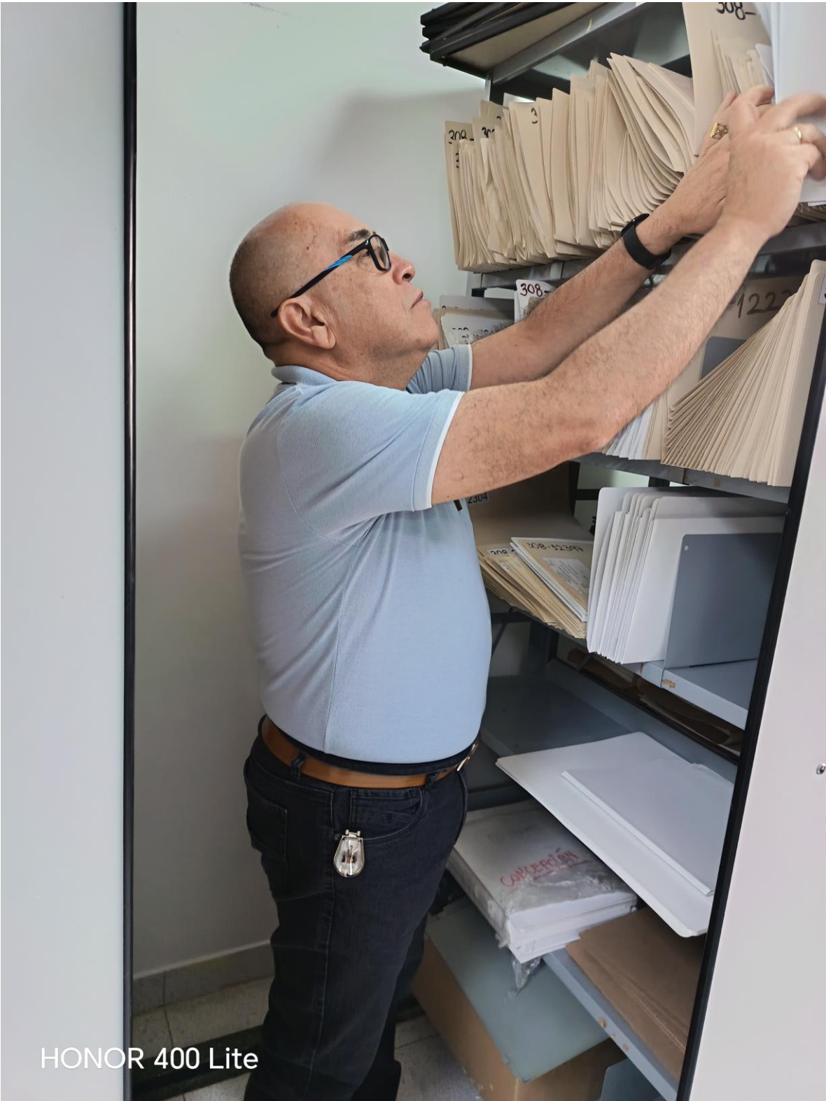
HONOR 400 Lite