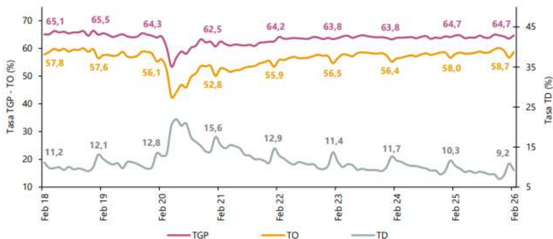
Gráfico 1. Tasa global de participación (TGP), Tasa de ocupación (TO) y Tasa de desocupación (TD) Total nacional Febrero (2018 - 2026)

Fuente: DANE, Gran Encuesta Integrada de Hogares (GEIH).