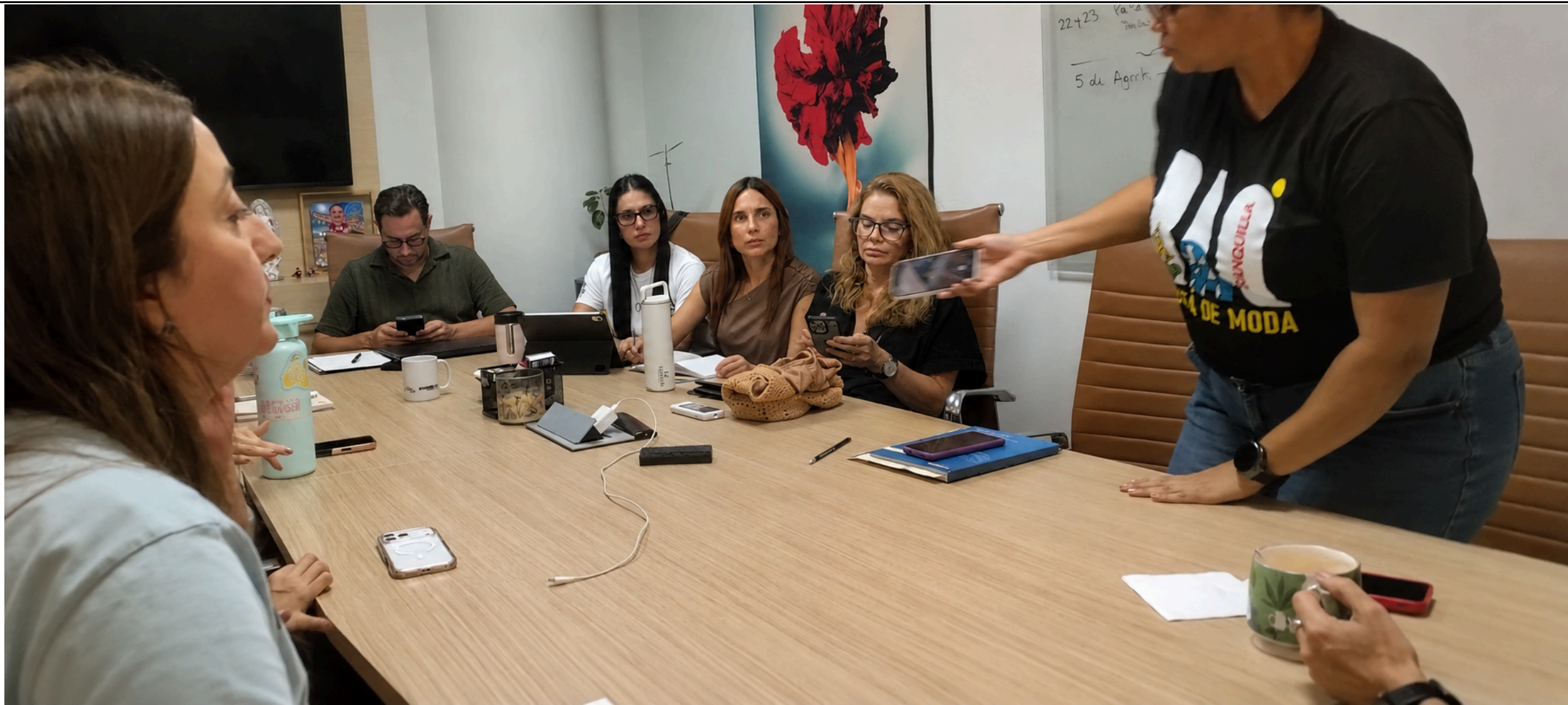
Donación op350 / secretaria de Educación