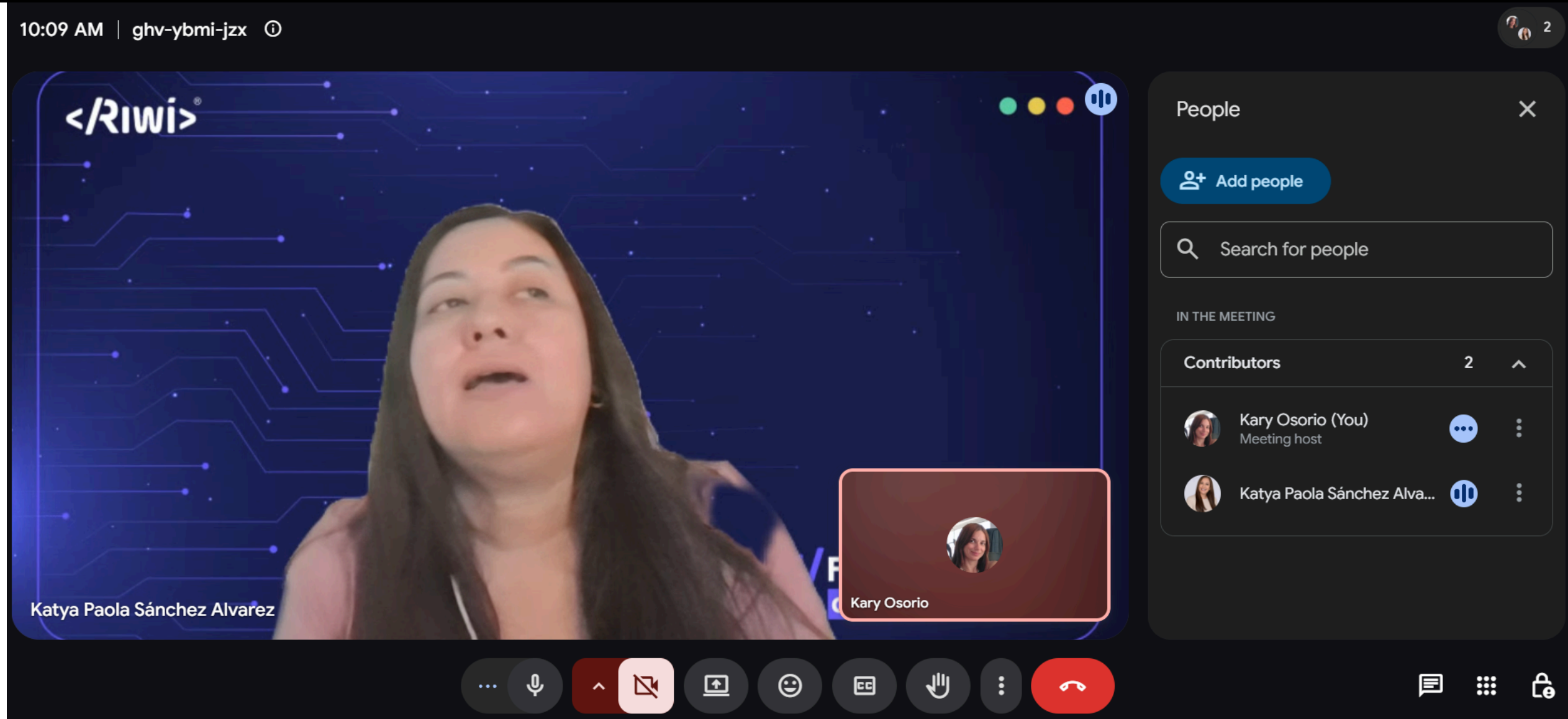
Reunión seguimiento Gerencia proyectos Especiales