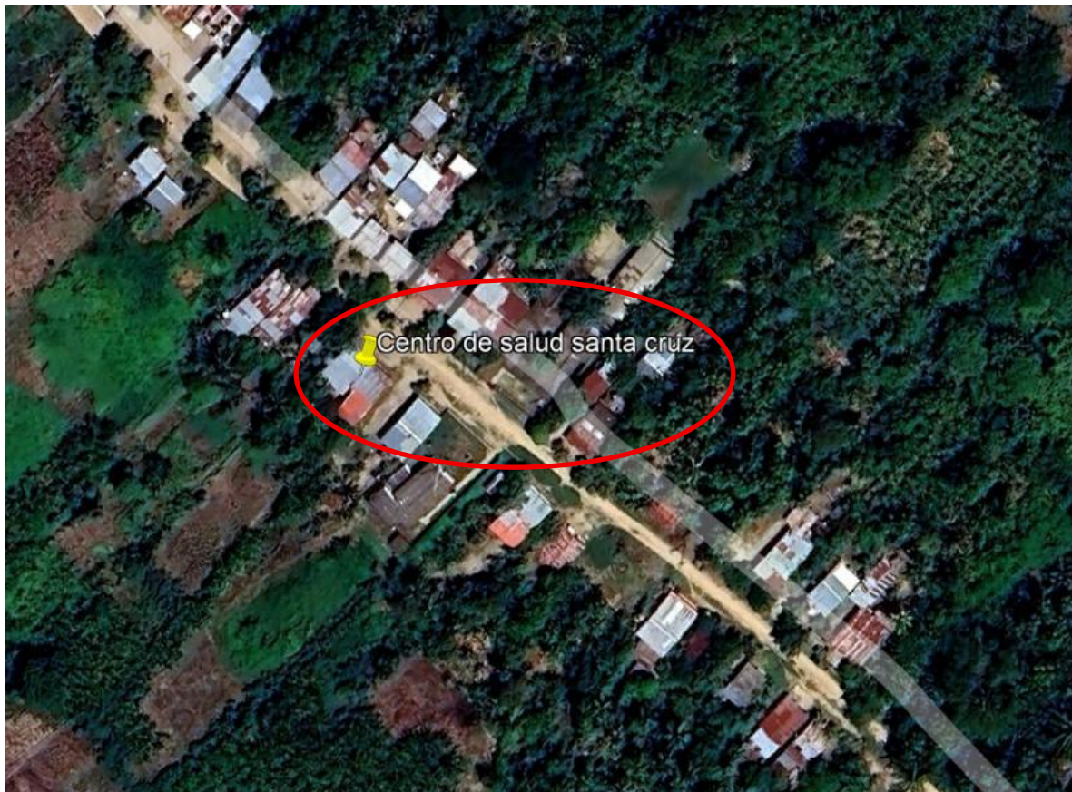
Figura No. 01. Localización de la obra pública.

A continuación, se presenta la siguiente figura en la cual se muestra la ubicación de la sede Centro de salud Candelaria de la E.S.E. Hospital Local Santa María de Mompos intervenida.