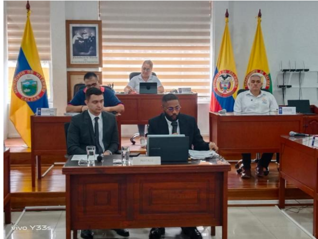
Anexo 3. Fotografías reuniones y labores realizadas en la Personería de Viterbo, Caldas