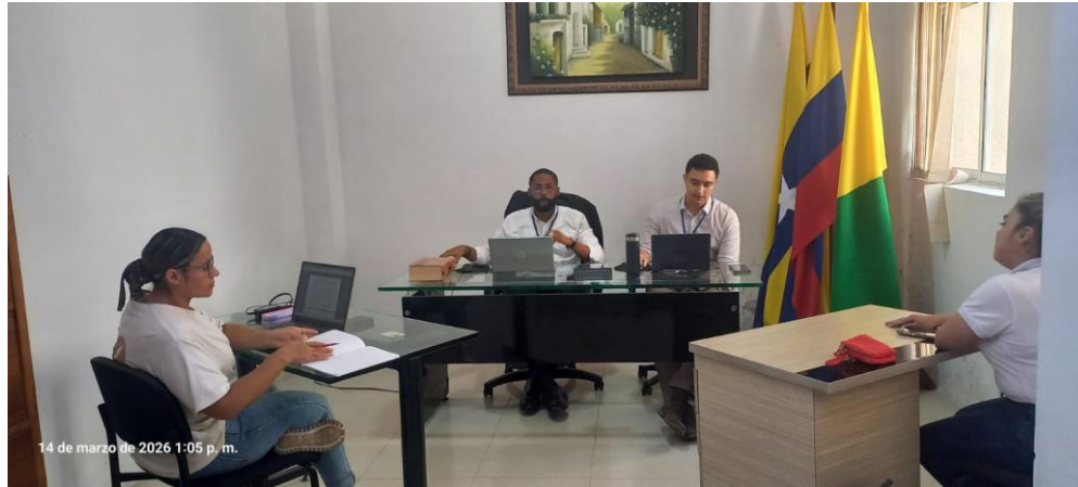
Anexo 5. Fotografía apoyo práctica de prueba testimonial en la Personería de Viterbo, Caldas