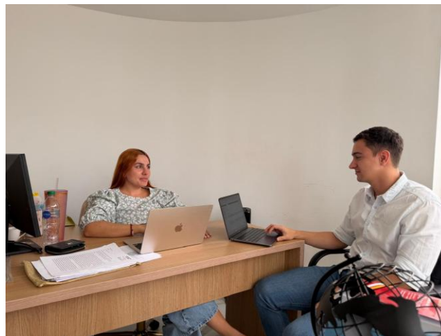
Anexo 5. Fotografía reunión 22 de mayo de 2026.