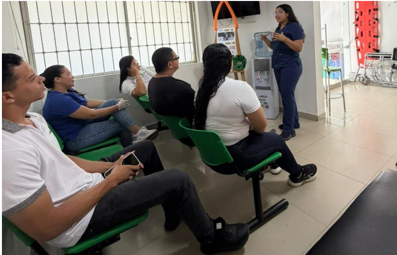
Evidencias fotográficas de la actividad en la EAPB Asmetsalud.