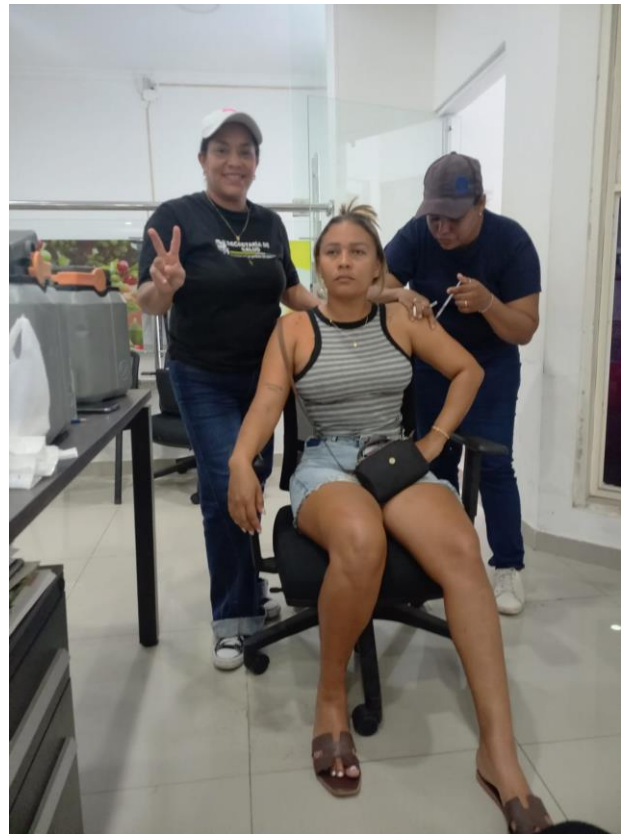
Evidencias fotográficas de la jornada de vacunación IPS CarboSalud.