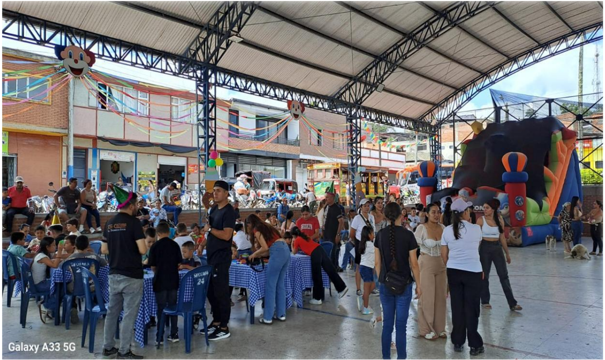
Galaxy A33 5G