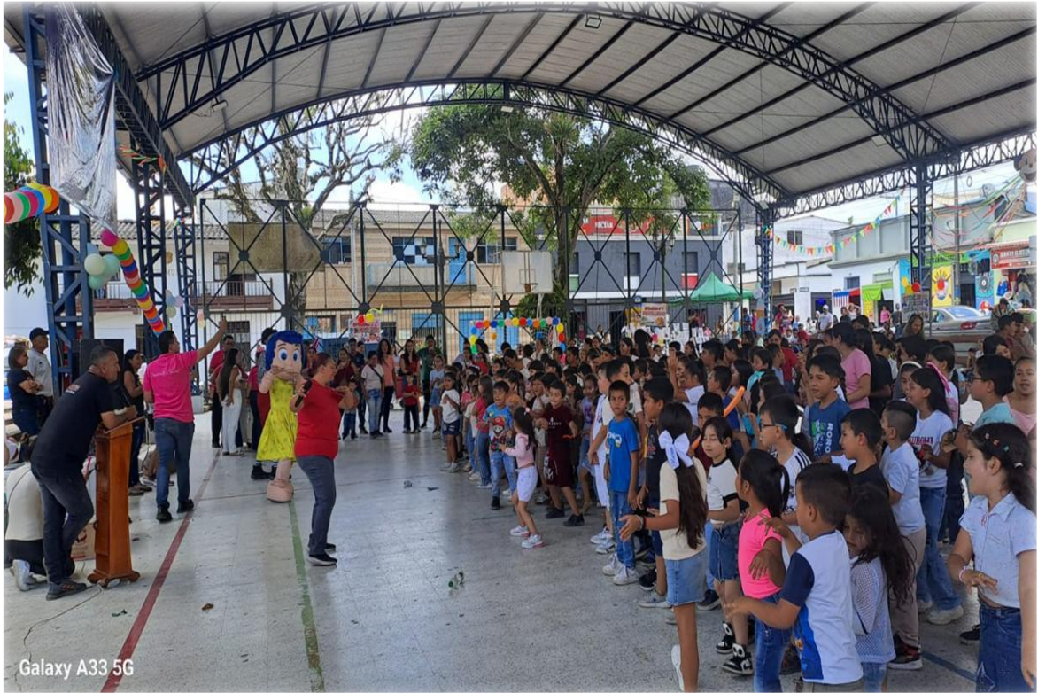
Galaxy A33 5G