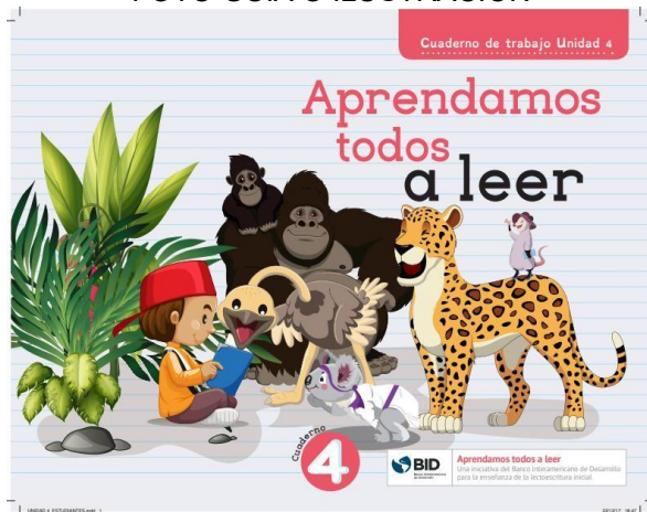
Guía del estudiante Unidad 4 Imágenes solo como referencia