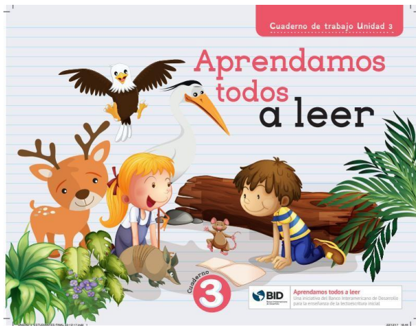
Guía del estudiante Unidad 3 Imágenes solo como referencia