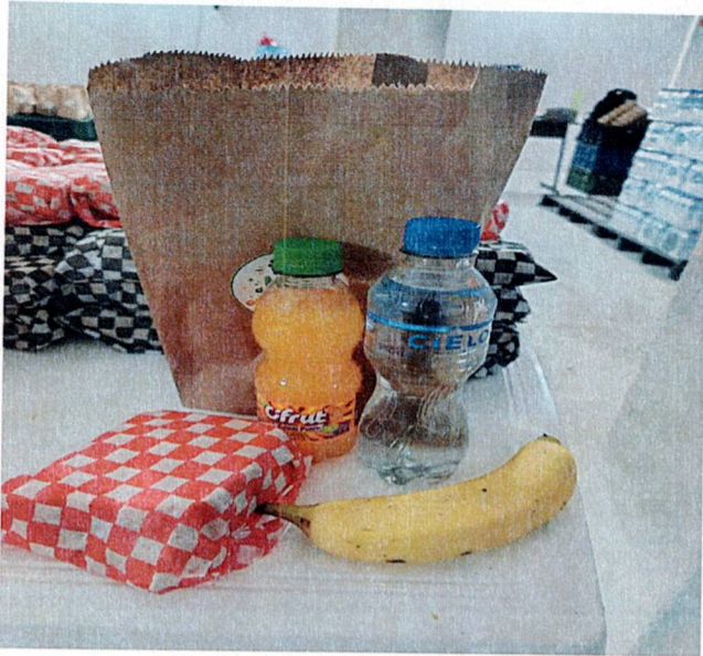
Actividad: Suministros de refrigerios e hidratación Lugar: puntos de votación y registraduría municipal