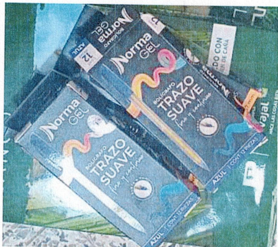
Actividad: entrega de bolígrafos tinta negra y azul Lugar: Registraduría municipal