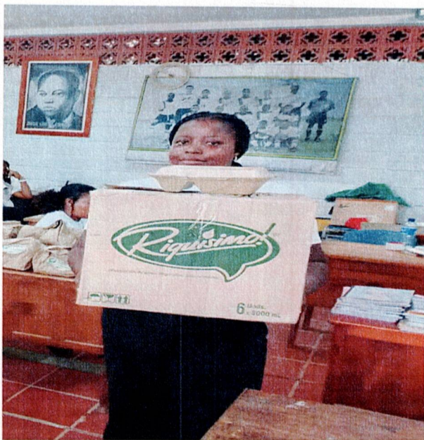
Actividad: suministro de cenas Lugar: Registraduría municipal