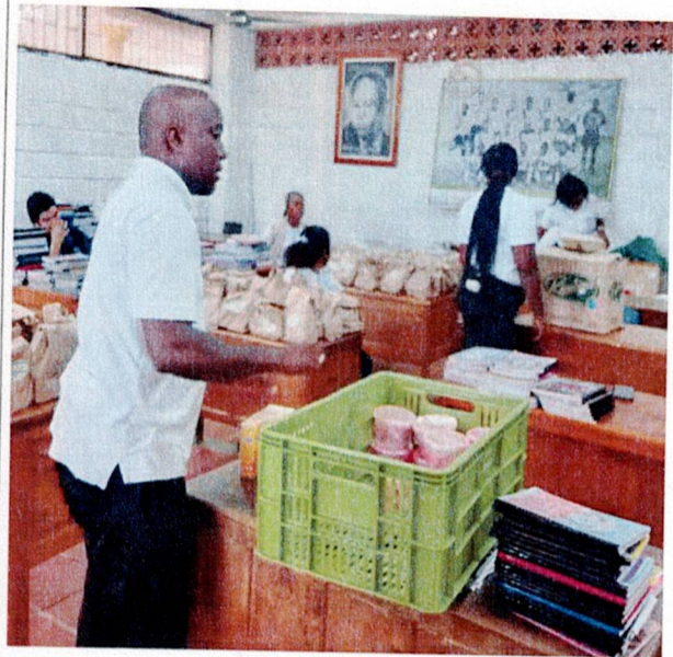
Actividad: suministro de almuerzos Lugar: Registraduría municipal