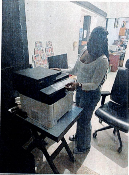
Actividad: Suministro de impresora Lugar: Registraduría municipal