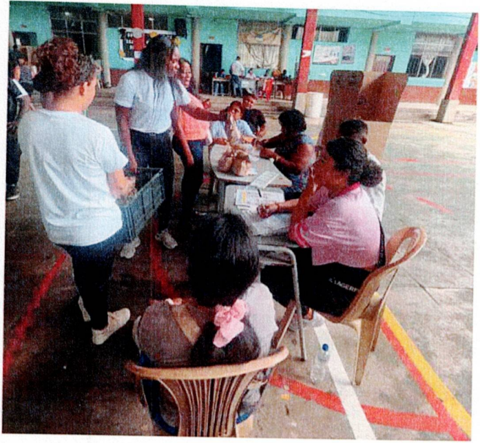
Actividad: Suministros de refrigerios e hidratación Lugar: puntos de votación y registraduría municipal