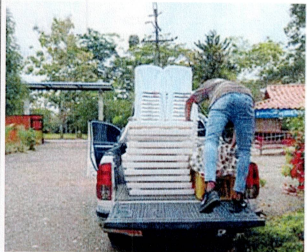
Actividad: servicio de camioneta Lugar: Registraduría municipal