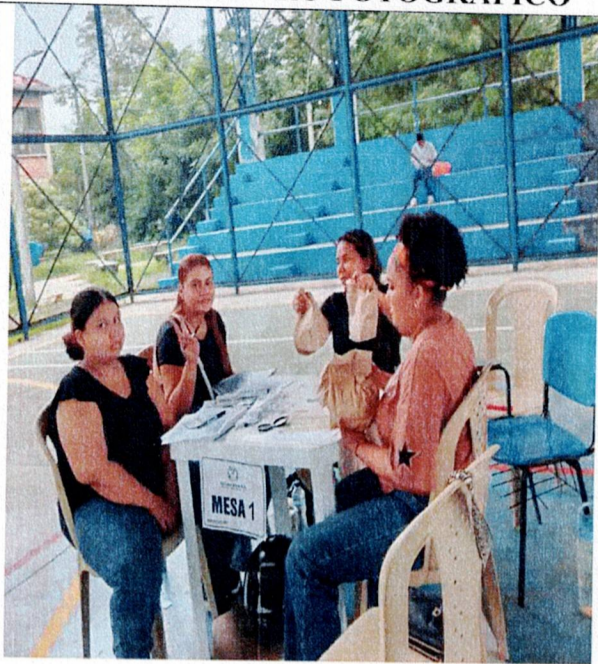
Actividad: Suministros de refrigerios e hidratación Lugar: puntos de votación y registraduría municipal