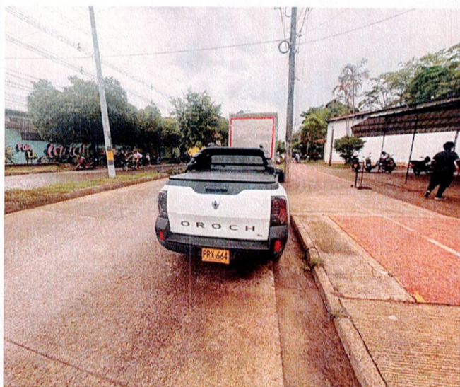
Actividad: transporte en camioneta Lugar: Corregimientos de Zungo Embarcadero, Piedras Blancas y El Silencio y recorridos internos