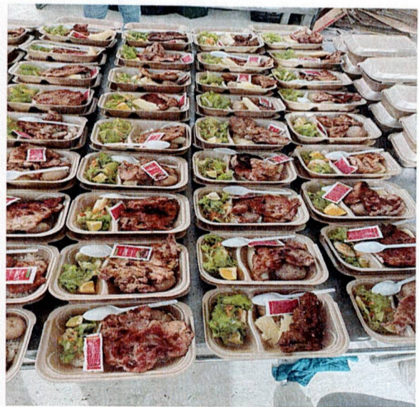
Actividad: suministro de cenas Lugar: Registraduría municipal