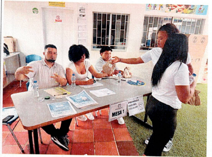
Actividad: Suministros de refrigerios e hidratación Lugar: puntos de votación y registraduría municipal