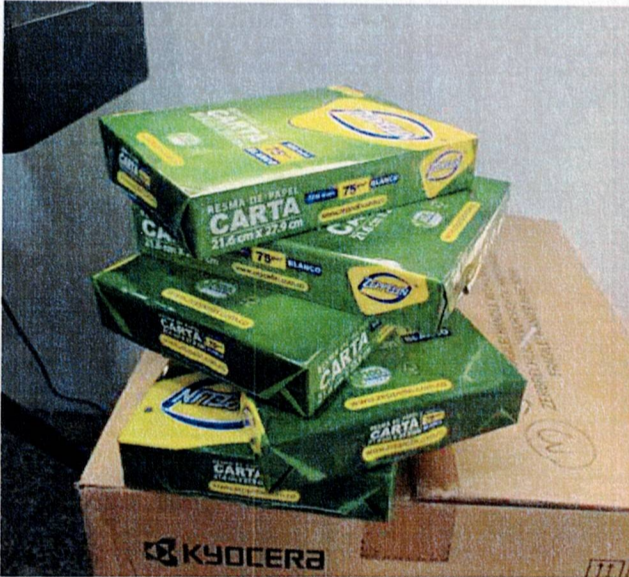
Actividad: entrega de resmas de papel tamaño carta Lugar: Registraduría municipal