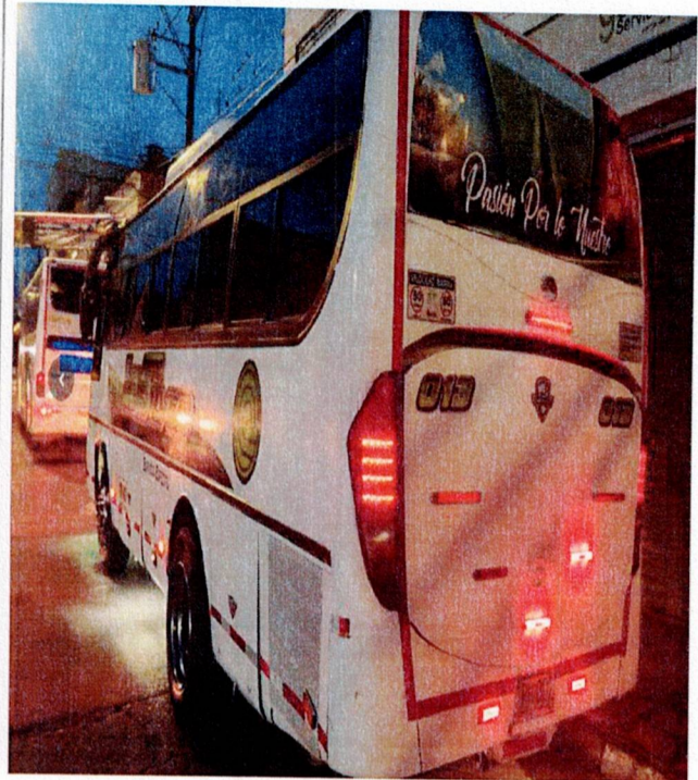
Actividad: servicio de transporte (buses) Lugar: Registraduría municipal