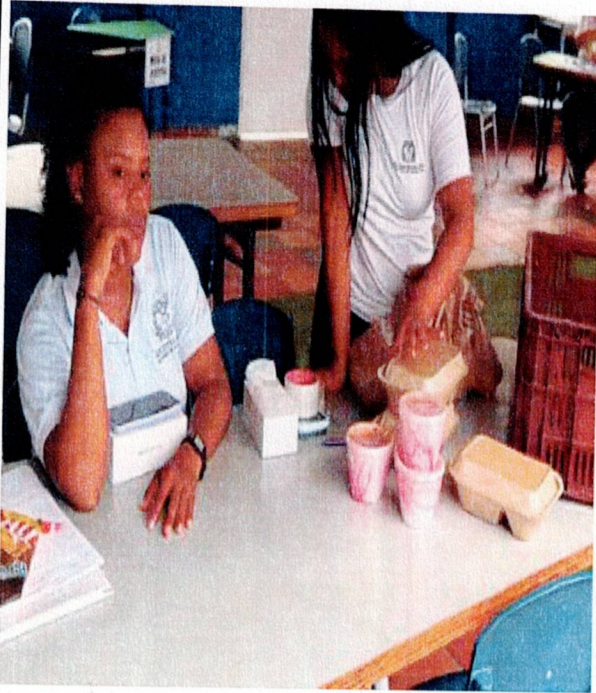
Actividad: suministro de almuerzos Lugar: Registraduría municipal