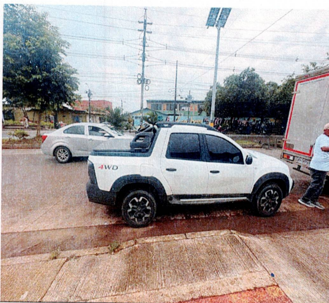
Actividad: transporte en camioneta Lugar: Corregimientos de Zungo Embarcadero, Piedras Blancas y El Silencio y recorridos internos