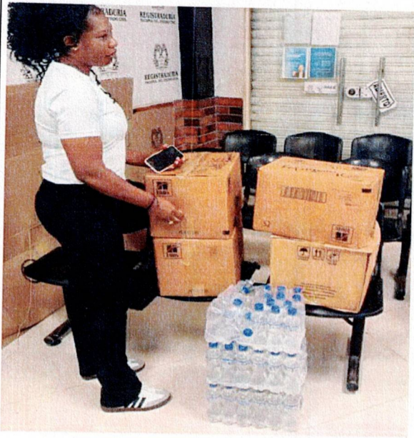
Actividad: suministro de almuerzos Lugar: Registraduría municipal