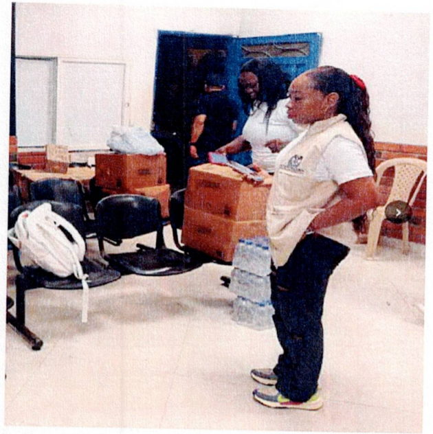
Actividad: suministro de almuerzos Lugar: Registraduría munic