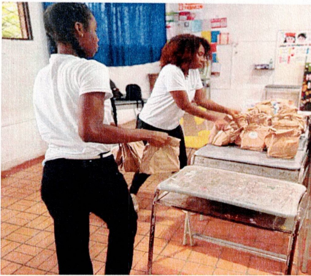
Actividad: Suministros de refrigerios e hidratación Lugar: puntos de votación y registraduría municipal