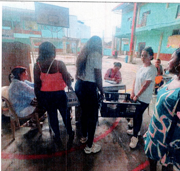
Actividad: Suministros de refrigerios e hidratación Lugar: puntos de votación y registraduría municipal