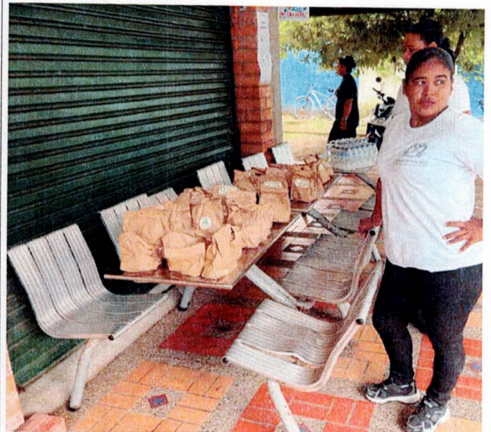
Actividad: Suministros de refrigerios e hidratación Lugar: puntos de votación y registraduría municipal