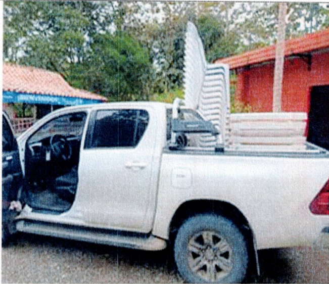
Actividad: servicio de camioneta Lugar: Registraduría municipal