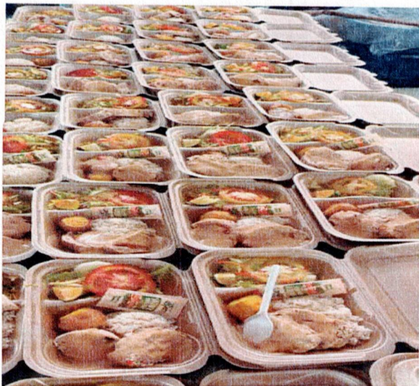
Actividad: suministro de almuerzos Lugar: Registraduría municipal