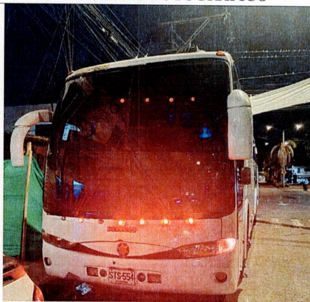
Actividad: transporte de buses Lugar: Corregimientos de Zungo Embarcadero, Piedras Blancas y El Silencio y recorridos internos