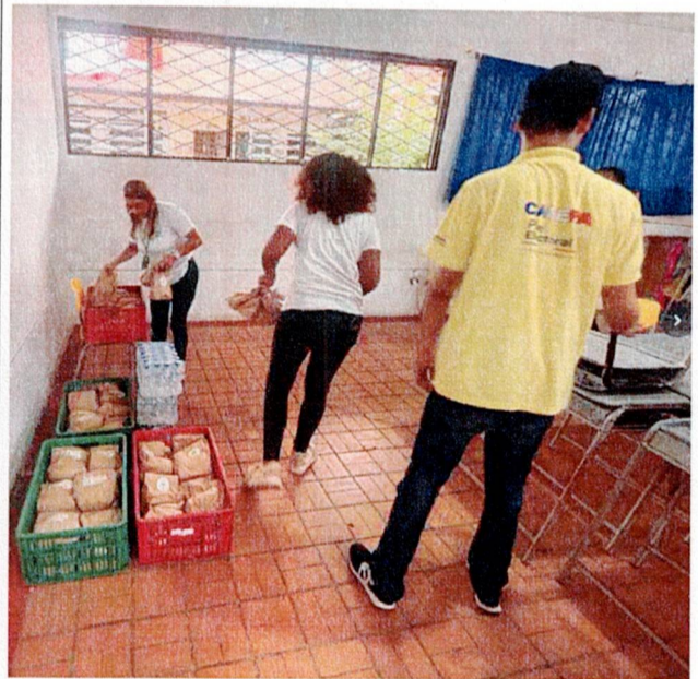
Actividad: Suministros de refrigerios e hidratación Lugar: puntos de votación y registraduría municipal