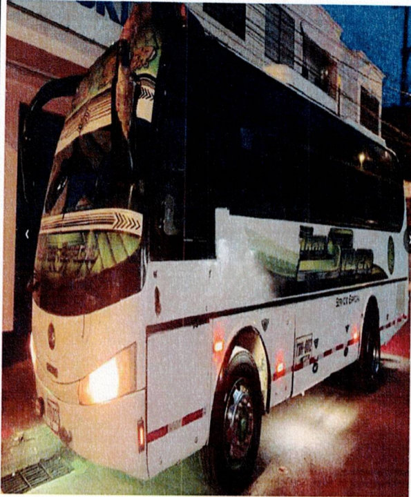
Actividad: servicio de transporte (buses) Lugar: Registraduría municipal