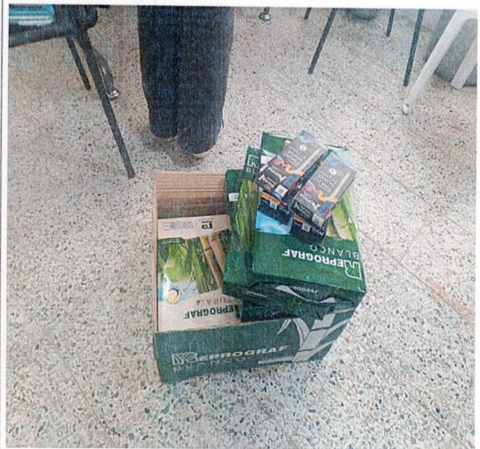
Actividad: entrega de Resmas de papel tamaño oficio Lugar: Registraduría municipal