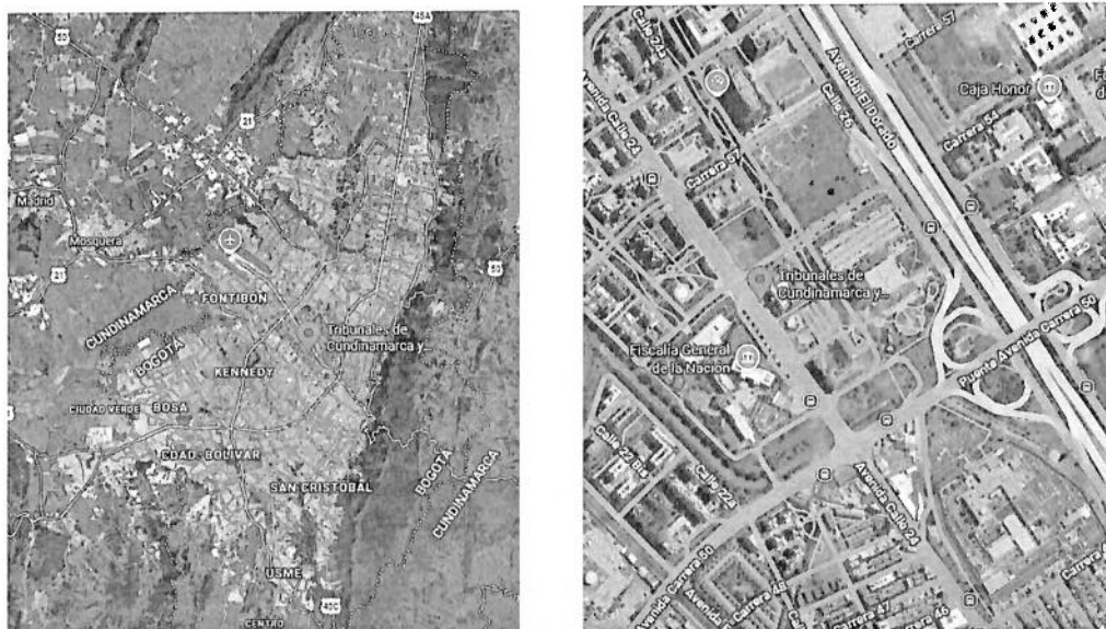
Imagen 3. Localización de la sede de los Tribunales de Bogotá y Cundinamarca

carrera 54, cerca de donde funcionan la Fiscalía General de la Nación y la Gobernación de Cundinamarca, considerada una de las más importantes de la Rama Judicial después del Palacio de Justicia de Bogotá.