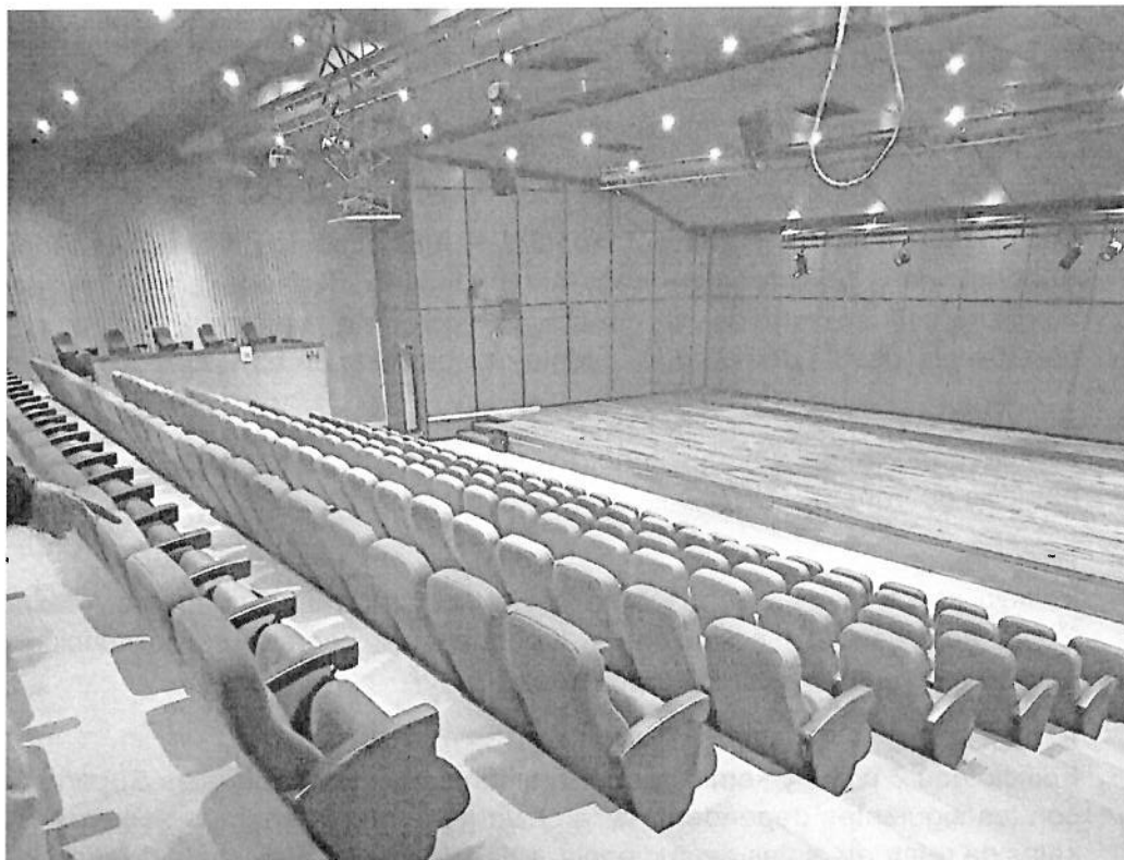
Imagen 1. Silletería del auditorio

A pesar de las intervenciones realizadas en la vigencia 2025, se ha podido identificar que, a través de la plazoleta central, la cual no ha sido intervenida, se están presentando filtraciones y humedades que comprometen el estado general de las instalaciones del auditorio, afectando principalmente en las maderas del cielo raso y de la tarima, así como también en los acabados del cuarto de control.