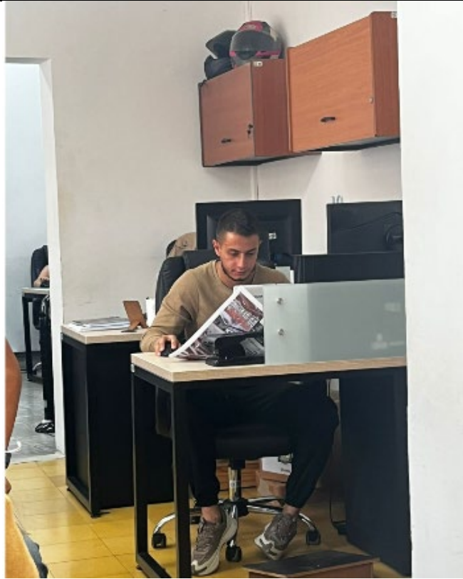
EVIDENCIAS FOTOGRÁFICAS ANEXO 5