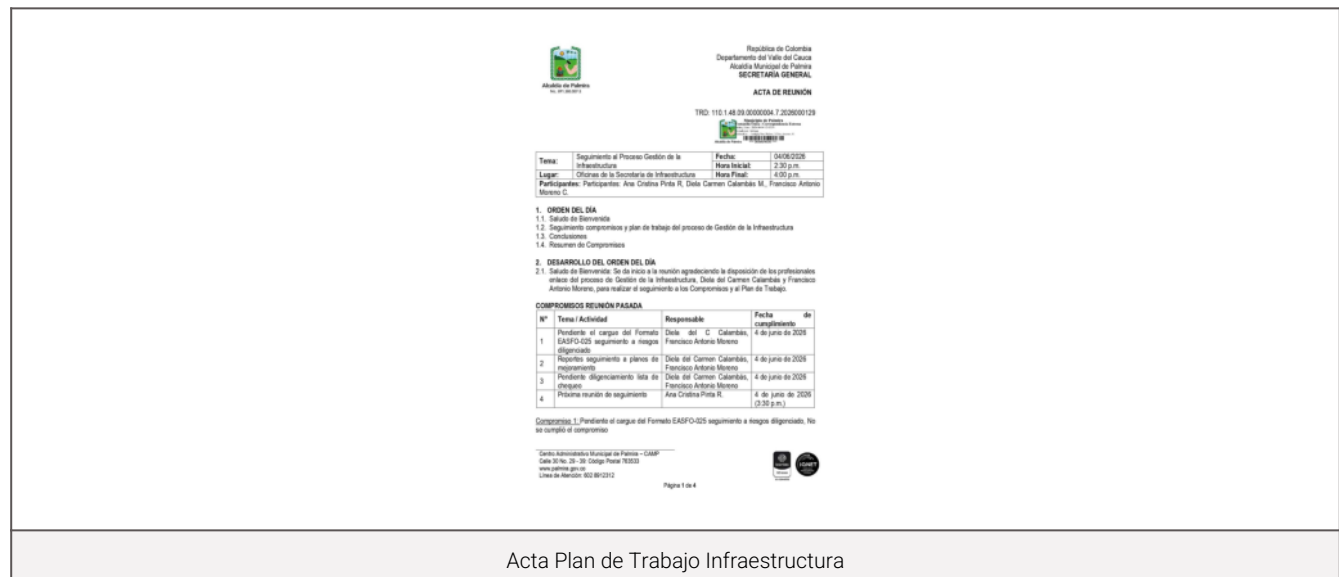
Acta Plan de Trabajo Infraestructura