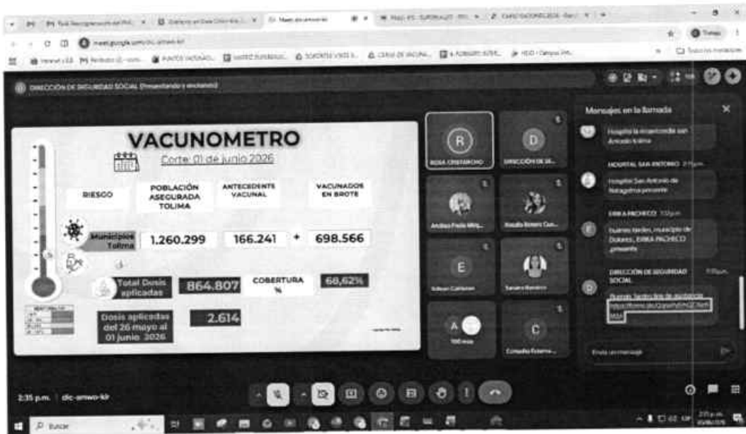
Cuadro de turno mes de junio