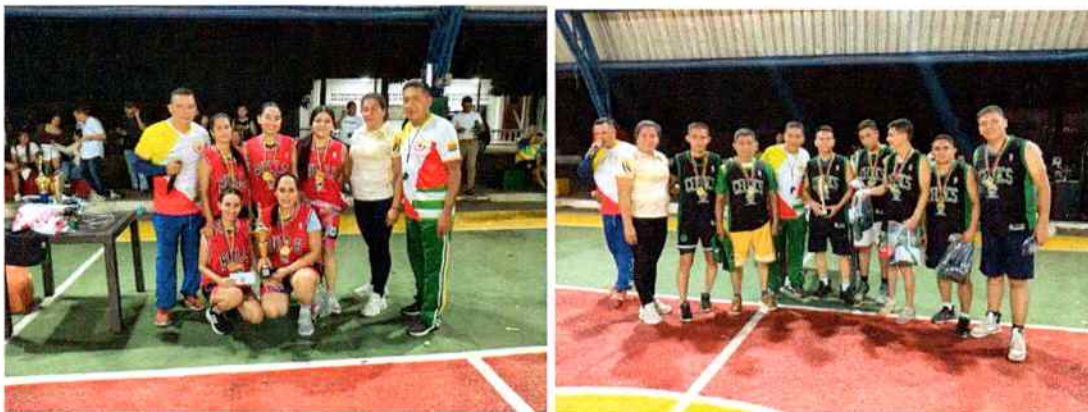
Nota: Final del campeonato de baloncesto