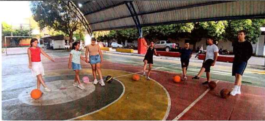
Nota: fotografía de actividad en baloncesto