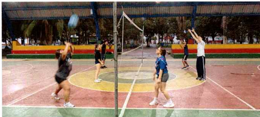
Nota: fotografía de actividad realizada de voleibol