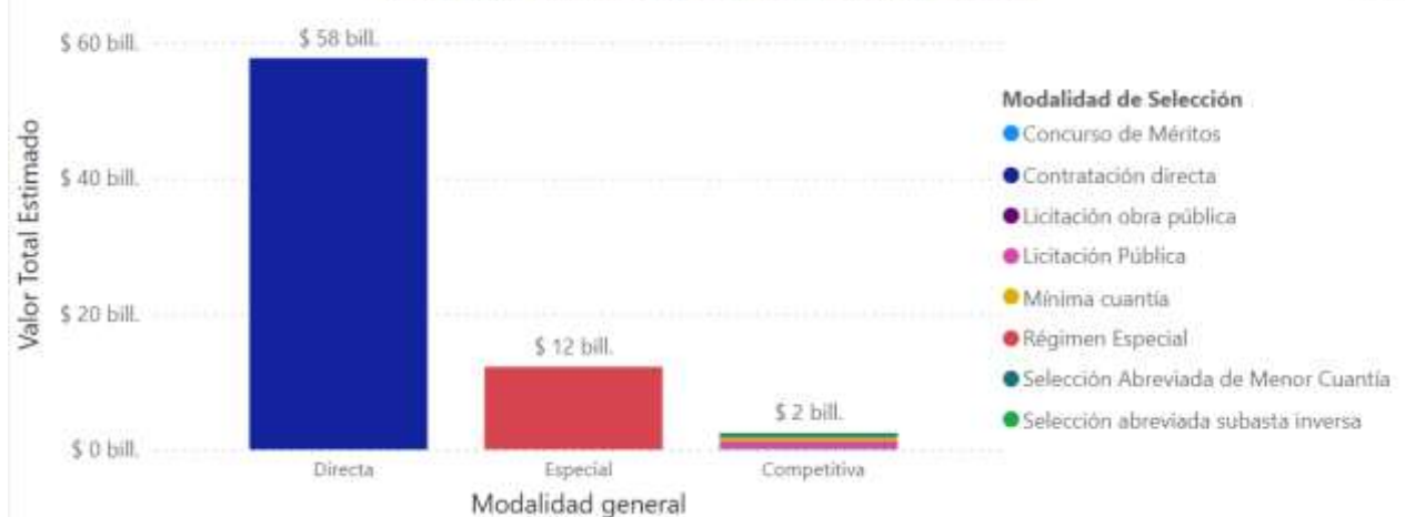
Valor Total Estimado por Modalidad de Selección