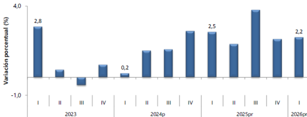
Gráfico 1. Producto Interno Bruto Tasa de crecimiento en volumen 1 2023-I / 2026 P -I