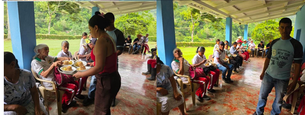
PORCION DE TORTA X 75 GMRS