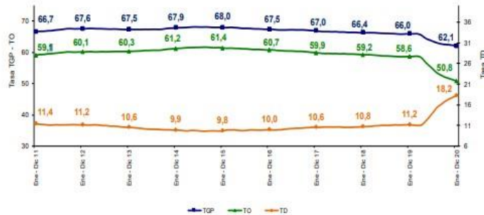
Gráfico 3. Tasa global de participación, ocupación y desempleo Total 13 ciudades y áreas metropolitanas Año (2011 – 2020)

En 2020, la tasa de desempleo en el total de las 13 ciudades y áreas metropolitanas fue 18,2%, lo que representó un aumento de 7,0 puntos porcentuales frente al 2019 (11,2%). La tasa global de participación se ubicó en 62,1%, lo que representó una disminución de 3,9 puntos porcentuales frente al 2019 (66,0%). Finalmente, la tasa de ocupación fue 50,8%, lo que significó una reducción de 7,8 puntos porcentuales respecto a 2019 (58,6%). 1