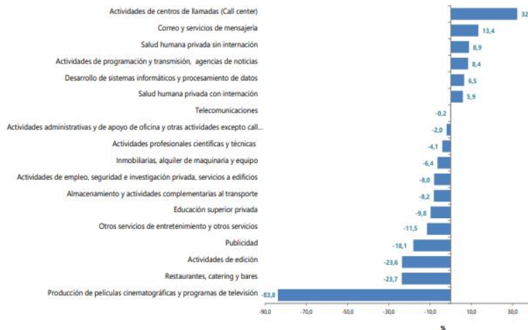
Gráfico 1. Variación anual de los ingresos nominales, según subsector de servicios Total Nacional Enero 2021 p

En enero de 2021, dos de los dieciocho subsectores de servicios presentaron variación positiva en el personal ocupado total, en comparación con enero de 2020.